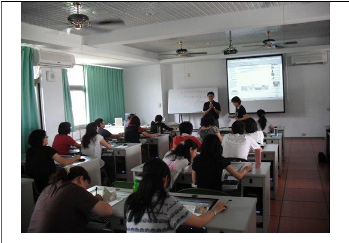
活動內容說明： 101.04.23 自由軟體在教學上應用研習 I：上課 講師與學校老師互動良好