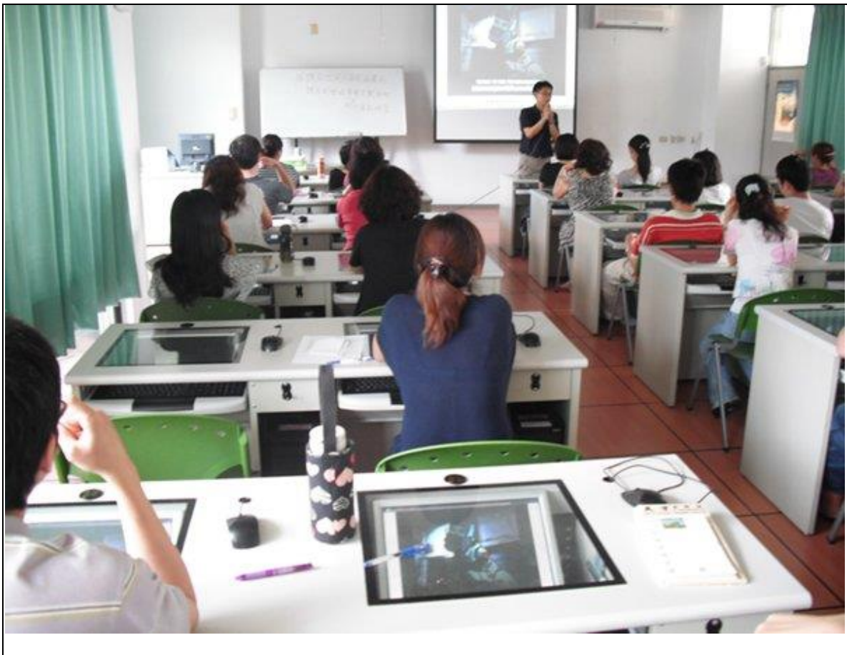
活動內容說明： 101.04.23 自由軟體在教學上應用研習 I：講師 有效運用影片吸引教師的目光