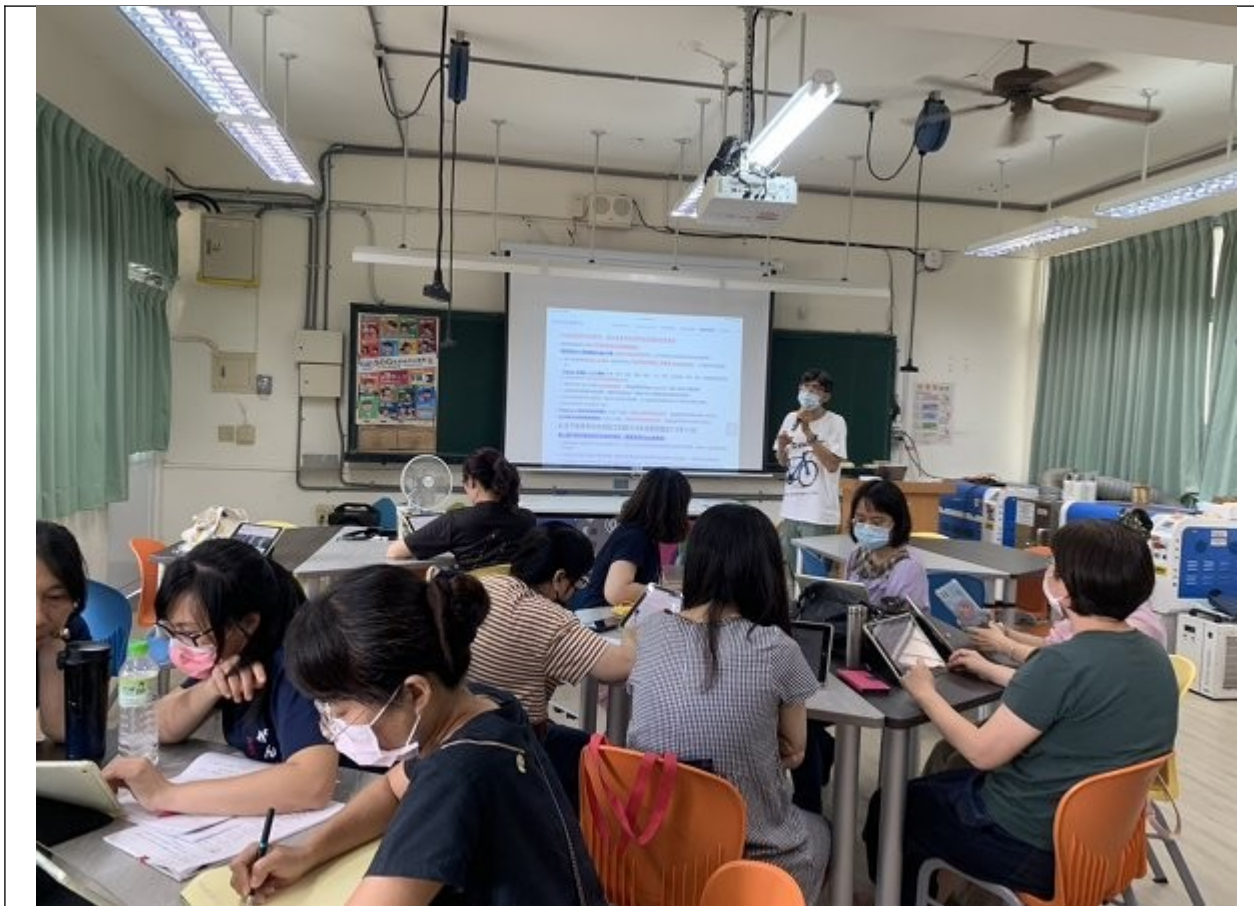
照片說明：講師講解時學員專心聽講